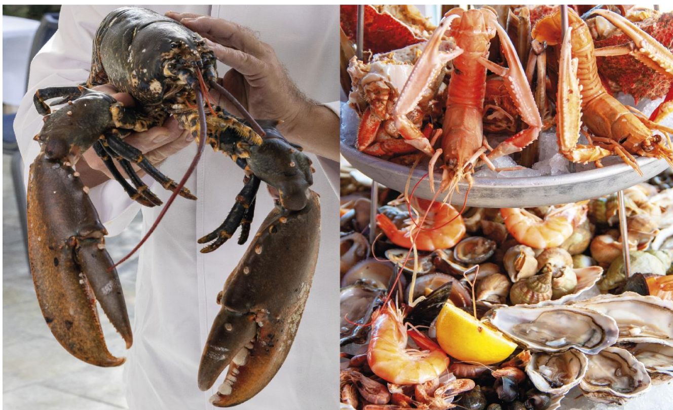
TABLE DE L'ERMITAGE

Breton blue lobster & Seafood platter on request 48 hours sur commande 48h avant*